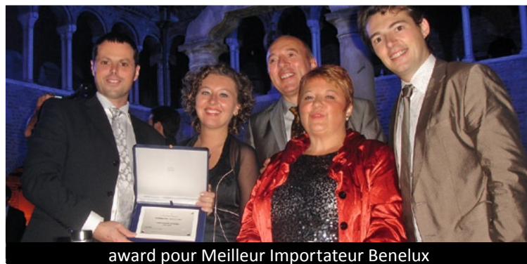
award pour Meilleur Importateur Benelux